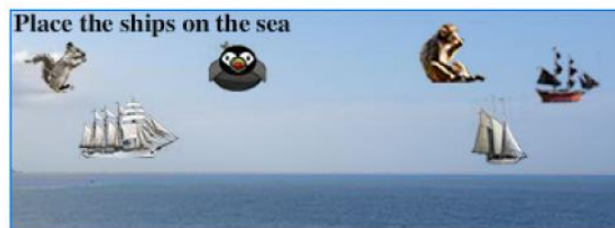
図 1 DCG CAPTCHA の例[2]

「CAPTCHA」というセキュリティ技術に「4コマ漫画の並び替え」というエンターテインメント因子を導入している。ユーザは、シャッフルされた4つのコマを起承転結が正しい順序となるように並び替える。人間のより高度な認知能力である「ユーモアを解する能力」を利用しているため、高い機械耐性を有する CAPTCHA が実現されている。通常の文字判別型 CAPTCHA よりも複雑な作業を正規ユーザに求めているものの、4コマ漫画を読む楽しさ、パズルを解く(4コマ漫画を正しく並び替える)楽しさが、利便性の低下を抑えている。