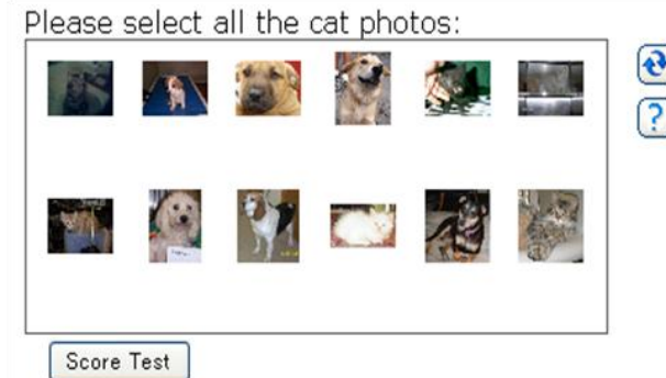
図 2 画像の CAPTCHA (Asirra) [6]

以下、2 章で既存研究の「4 コマ漫画 CAPTCHA」について簡単に紹介し、その課題を挙げる。3 章では 4 コマ漫画 CAPTCHA の課題に対しいくつかの解決策を示す。4 章でそれら解決策の有効性を比較実験により評価し、5 章で本稿をまとめる。