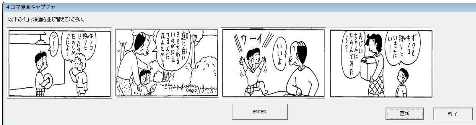
図3 既存の4コマ漫画 CAPTCHA の認証画面例

(出展：左からそれぞれ：文献[10]のP.25の4コマ漫画の1コマ目、4コマ目、3コマ目、2コマ目)